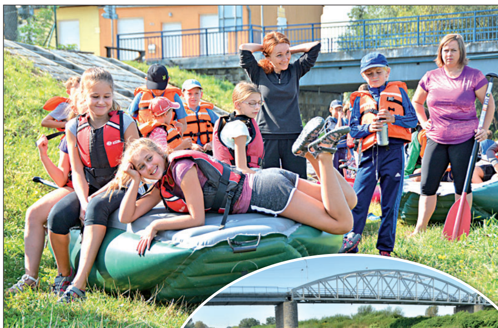
Čtyřicetka dětí sjížděla v rámci adrenalinového tábora Odru.

Zkušenost s nerudným šoférem však vzápětí napravil další skvělý zážitek. Parta z tábora sjížděla 24. srpna Odru. A protože v každém plavidle byla nutná přítomnost dospěláka, jízdu si kromě školáků, dvou stálých vedoucích a externistů užili i někteří rodiče a dobrovolníci. „Děkujeme všem a zejména pracovníkům místní dm drogerie markt, kteří kvůli akci zorganizovali dobrovolnický den,“ dodal Kalous s tím, že