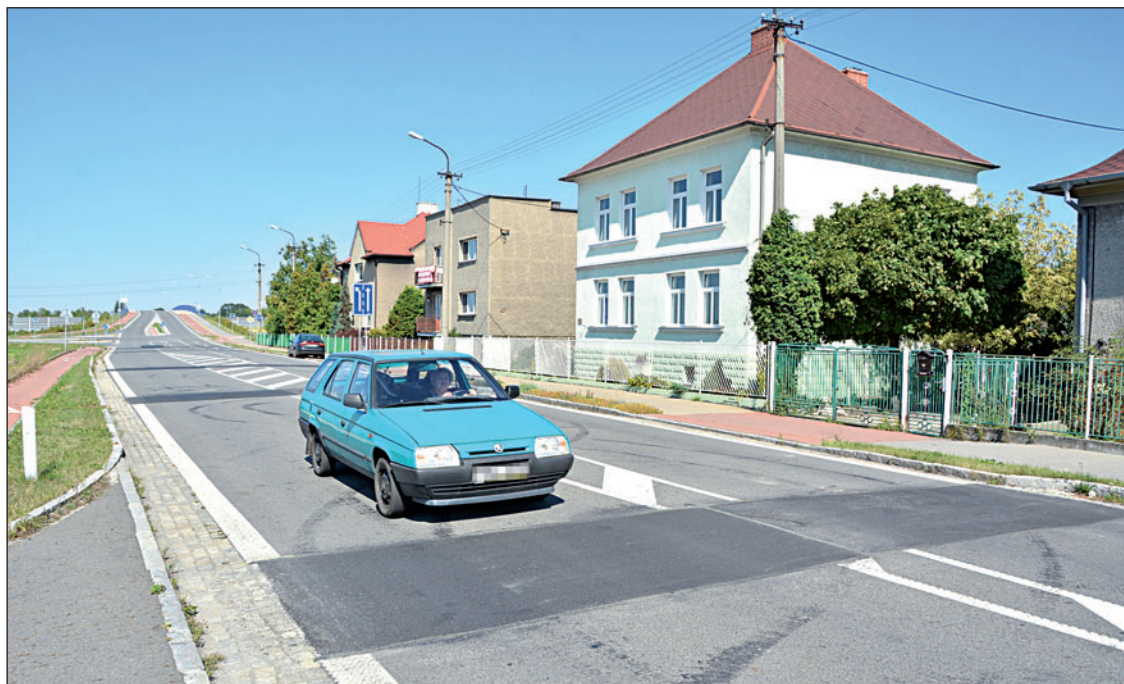
»Nová« Slezská ulice je v provozu pouze sedm let a už je záplatovaná. Silničáři museli odstranit zvlnění vozovky.