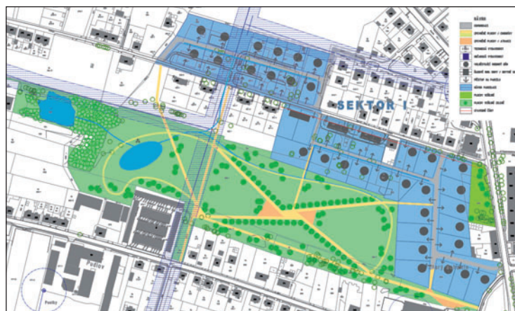
Studie k plánované revitalizaci lokality Petra Cingra. Modře jsou vyznačeny plochy, kde se počítá s rodinnou výstavbou.

Lokalitu je nejprve nutné odvodnit, připravit k zasítování a rozparcelování. Proto zde v roce 2012 proběhl hydrologický průzkum. „Sázet budeme v území i novou zelení. Až bude vše připraveno, nabídneme pozemky k prodeji v licitaci podobně jako v Záblatí ve Slu-