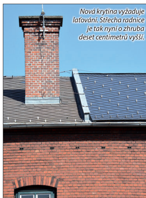
Nová krytina vyžaduje laťování. Střecha radnice je tak nyní o zhruba deset centimetrů vyšší.