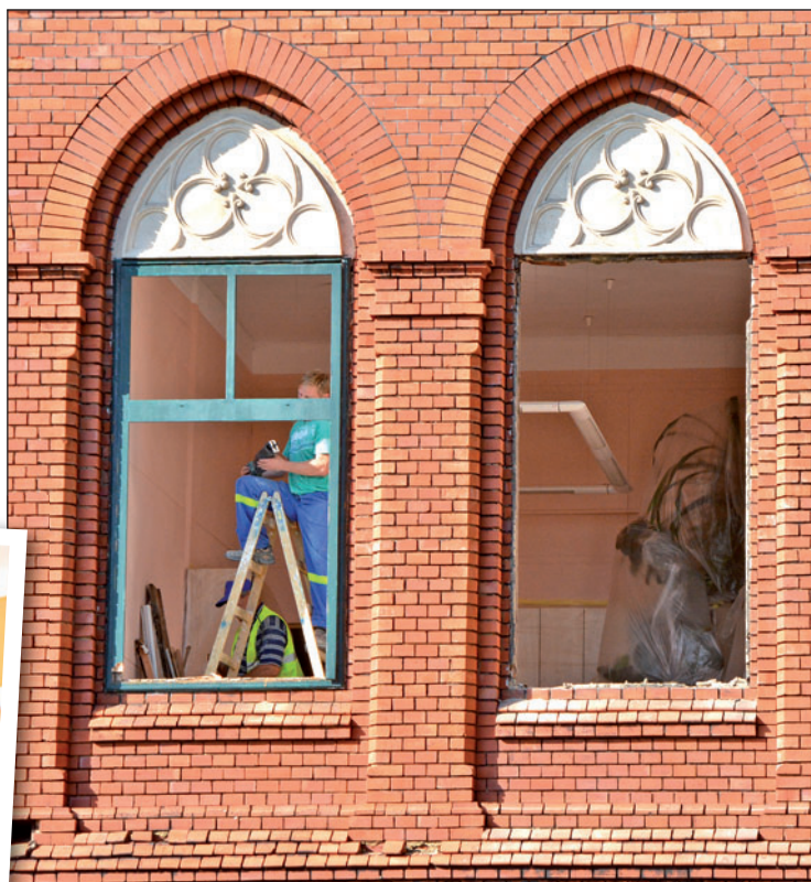
Po vyčištění zadní fasády došlo také na výměnu oken. Ta jsou věrnými replikami původních, pouze mají navíc izolační dvojskla.

ale z bezpečnostních důvodů zamřížovaná okna potřebuje,“ vysvětlila Hana Kaspráková z odboru rozvoru a investic.