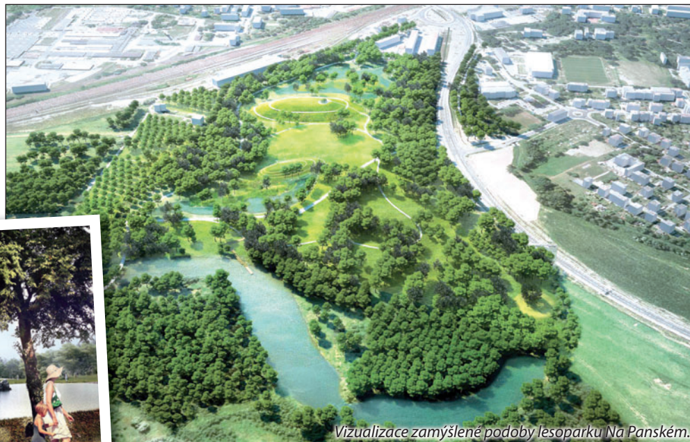
Vizuální záměr zamýšlené podoby lesoparku Na Panském.

Bohumíňákům by měl park sloužit k procházkám, odpočinku a klidnějším aktivitám. Do lesoparku bude možné vstoupit z několika stran, včetně napojení na centrum města. Pro pěší a cyklisty vzniknou chodníčky i cyklostezky. V plánu je výsadba stromů a keřů a také založení mokřadů a tůňek. V lokalitě by měla vyrůst i umělá návrší, mezi nimiž se počítá s otevřeným prostorem – loukou.