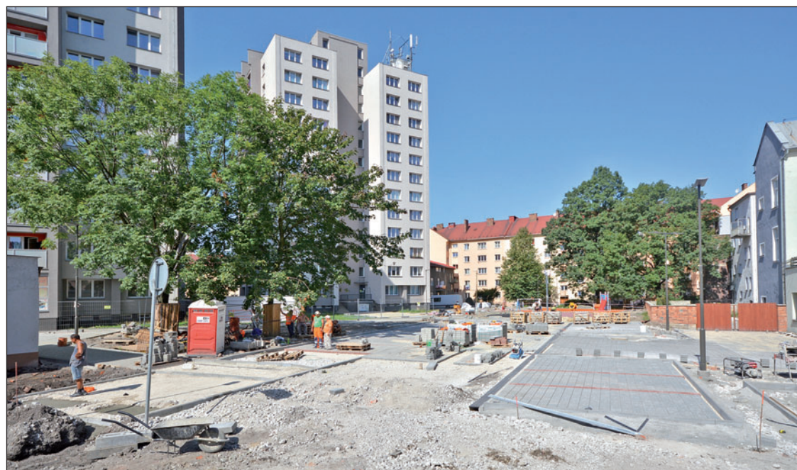
Nová parkoviště, chodníky, dětské hřiště. Moderní podoba dvora už se rýsuje.