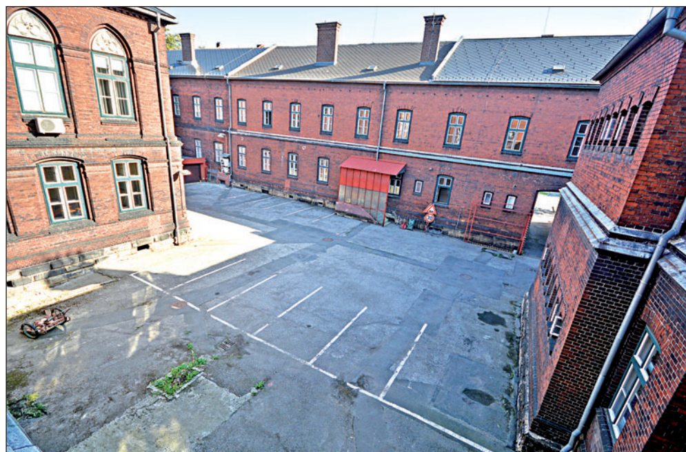
Z radničního dvora zmizí nevkusný plechový přístřešek a flikovaný asfalt nahradí betonová dlažba.

dosavadní hrbolatý a záplataný asfaltový povrch nahradí betonová dlažba. Ne v podobě klasické zámkové, ale formou obdélníkových