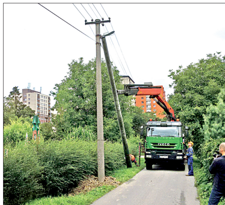
ČEZ v Záblatí obnovuje 45 let staré vedení nízkého napětí. Město současně vymění sodíkové lampy za moderní ledkové.