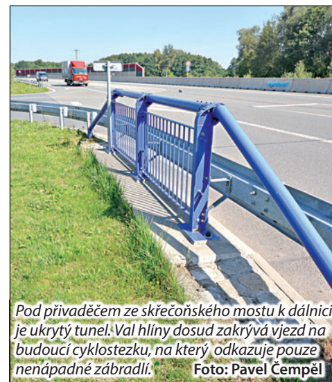
Pod přivaděčem ze skřečošského mostu k dálnici je ukrytý tunel. Val hlíny dosud zakrývá vjezd na budoucí cyklostezku, na který odkazuje pouze nenápadné zábradlí.