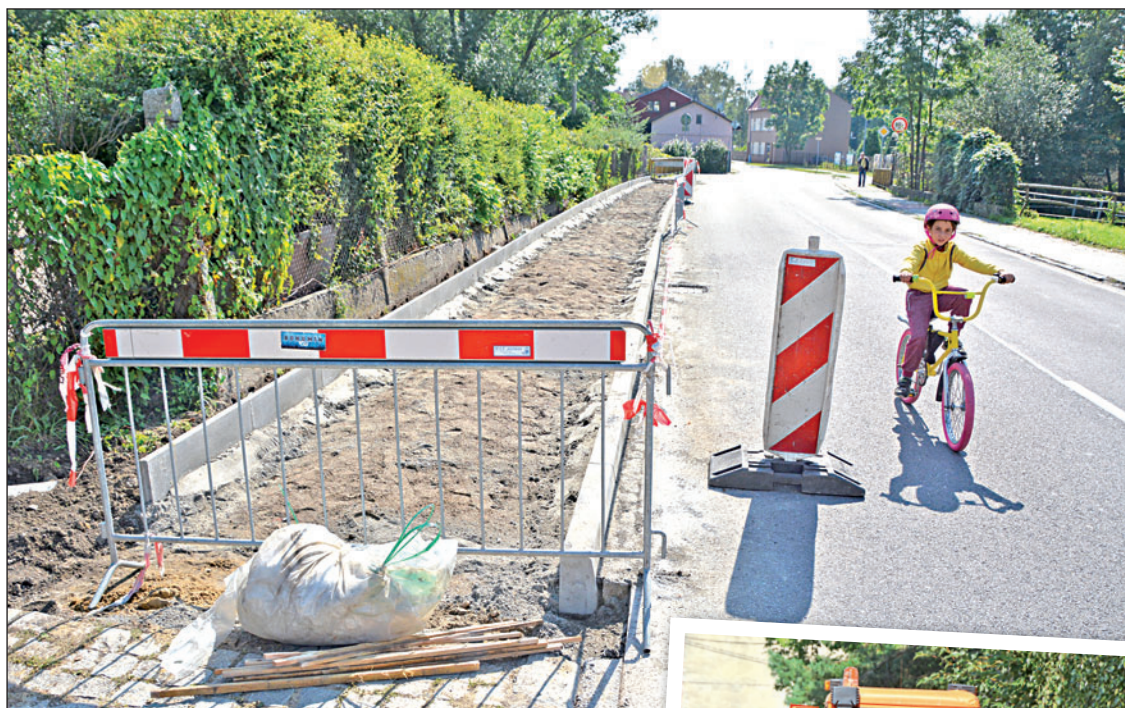
Koncem srpna proběhla oprava téměř stometrového chodníku poblíž zbrojnice ve Starém Bohumíně.

Pro obyvatele jsou jednou z priorit a město k nim přistupuje stejně. Na komunikace vynakládá každoročně miliony. A pokud to rozpočet umožní a stav cest a chodníků vyžaduje, finance se ještě během roku průběžně navyšují. Jen u chodníků se letos náklady vyšplhaly na 9,5 milionu.