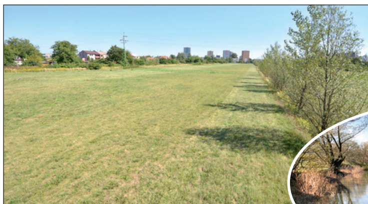
Volnou plochu o rozloze asi pěti hektarů čeká nejprve odvodnění. Část má následně sloužit k výstavbě, druhá bude patřit upravené zeleni. Do proměny celého území chce město zakomponovat i rybníček Suchého stav.

Zastavěná část ulice Petra Cingra měla v minulosti pověst ghetta. V rámci projektu »nulové tolerance« jej ale radnice této nelichotivé nálepky zbavila. V letech 2010 a 2011 nechala zdemolovat šestici vybydlených a zdevastovaných domů. O dva z nich měl původně zájem soukromý investor, který je chtěl zrekonstruovat a dát jim moderní podobu. Zůstalo ale jen u slibů, a tak šly nakonec i tyto domy k zemi. Na jejich místě to dnes už zase žije. Parcely po demolicí město v licitaci nabídlo ke stavbě rodinných domů a dva menší bungalovy tady už nyní stojí. (balu, tch)